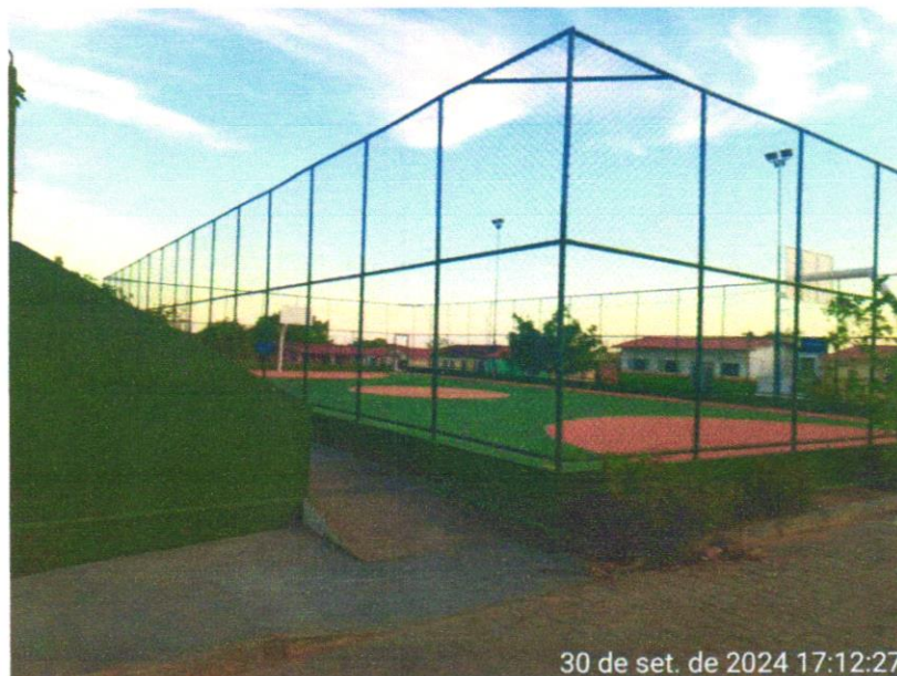
Foto 06 - PINTURA DE PISO COM TINTA ACRÍLICA, APLICAÇÃO MANUAL, 2 DEMÃOS, INCLUSO FUNDO PREPARADOR. AF_05/2021