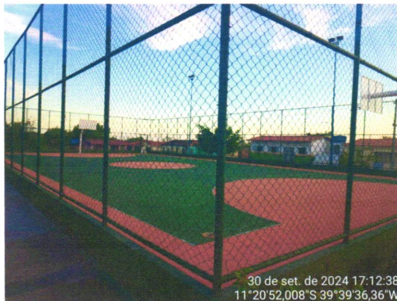
Foto 05 - PINTURA DE PISO COM TINTA ACRÍLICA, APLICAÇÃO MANUAL, 2 DEMÃOS, INCLUSO FUNDO PREPARADOR. AF_05/2021