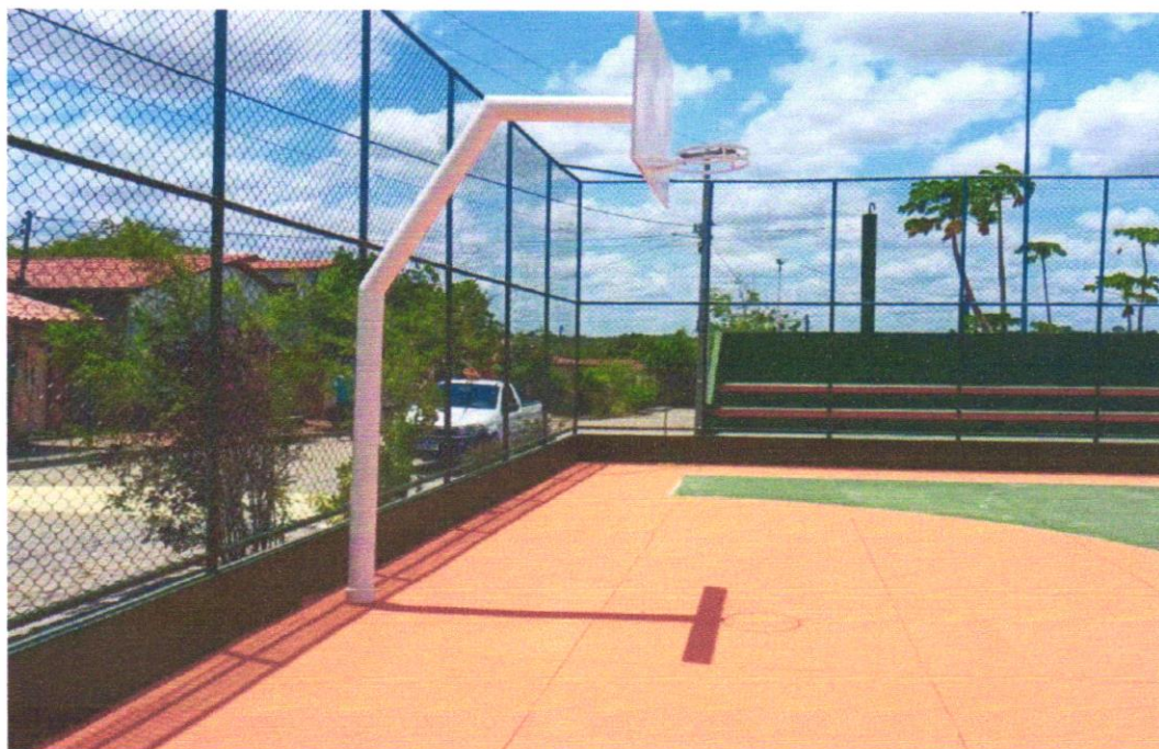
Foto 03 – Estrutura metálica fixa, p/ tabela em aço com aro e cesta p/ basquete, padrão oficial, em tubo galvanizado d=5" - instalada