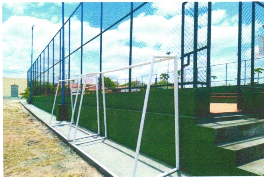
Foto 01 - Traves oficial para futebol de salão 3x2m em aço galv.3", com requadro e redes de polietileno fio 4mm (conjunto p/futsal)