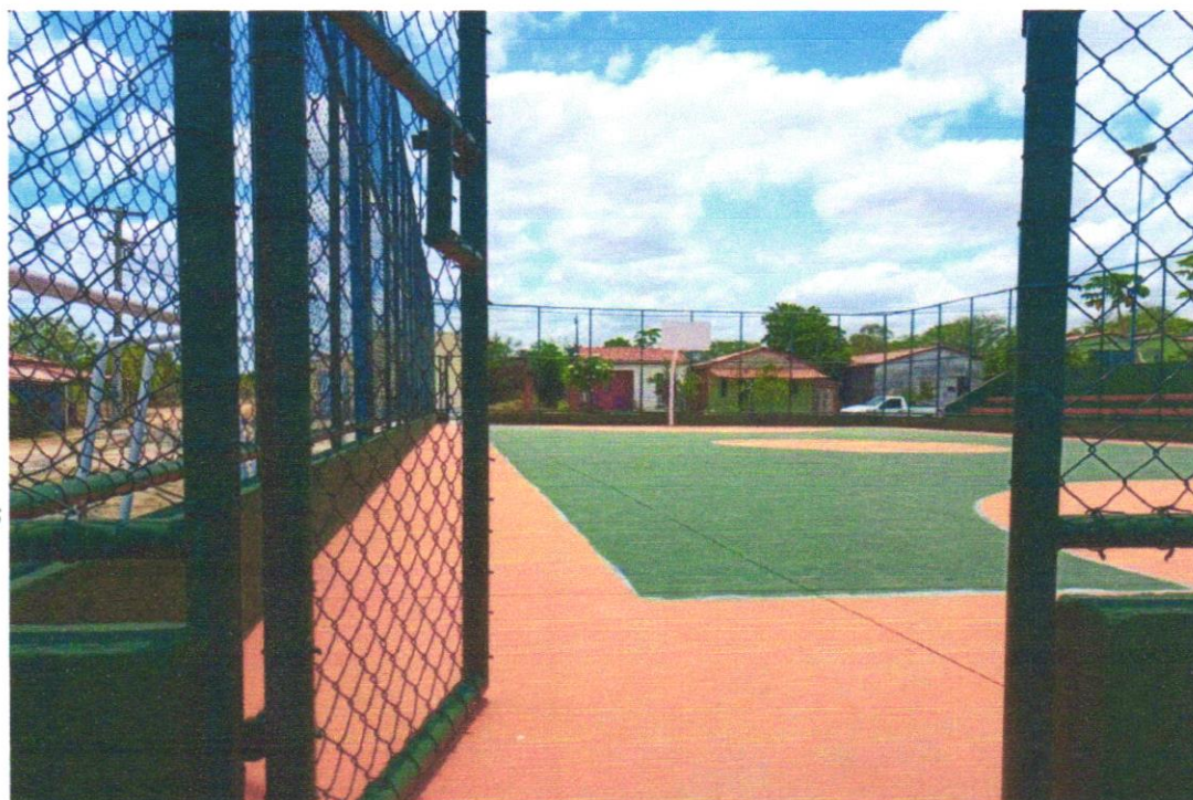
Foto 04- Estrutura metálica fixa, p/ tabela em aço com aro e cesta p/ basquete, padrão oficial, em tubo galvanizado d=5" - instalada