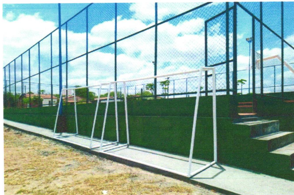
Foto 02 – Traves oficial para futebol de salão 3x2m em aço galv.3", com requadro e redes de polietileno fio 4mm (conjunto p/futsal)